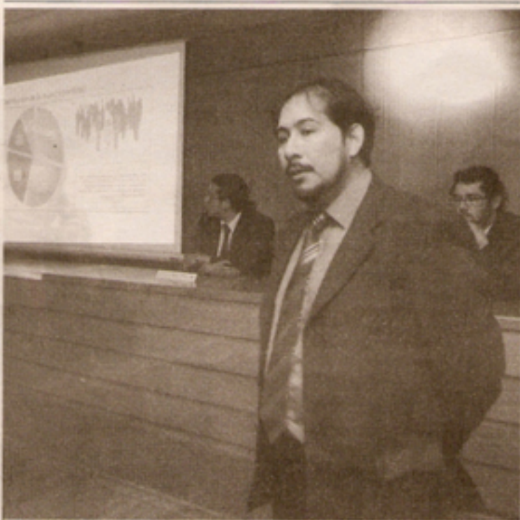
Los directivos de la consultora creada en enero de este año, dieron a conocer los detalles de la medición aplicado a 183 hombres y 201 mujeres.

Sondeo aplicado a 384 personas, revela además que las instituciones en que más confían son las policías (22,3) y la prensa local (19,8) y que el candidato mejor perfilado para el 2010 es Sebastián Piñera, seguido de Ricardo Lagos